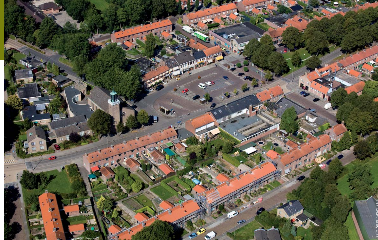
Ens werd gesticht in 1946 en heeft huizen met puntaken, gebouwd in de traditionele stijl van de Delftsche School. Er is veel groen in de vorm van tuintjes en openbaar groen.

Ook in Marknesse is de brink een verzamelplaats voor voorzieningen zoals het busstation, winkels en een kerk. Hier is het karakter van de brink echter aangetast. 'In veel polderdorpen herken je de grintbetontegels en plantsoenaanleg van de jaren zeventig op de dorpsbrinken. De jaren zeventig, tachtig en negentig lieten hun sporen na, die opgeteld een rommelig dorpsbeeld opleveren', legt