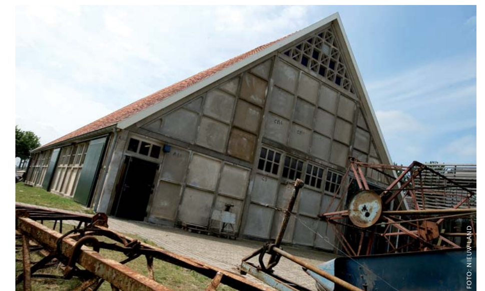
De typerende schokbetonnen 'Polderschuur' uit de Noordoostpolder.

drang naar behoud, maar op zoek naar identiteit. Als je die respecteert kun je nieuw bouwen', stelt Van Assen. Want het leven staat ook in de polder niet stil. De rijtjeshuizen uit de jaren vijftig voldoen niet allemaal meer aan de wooneisen van deze tijd.