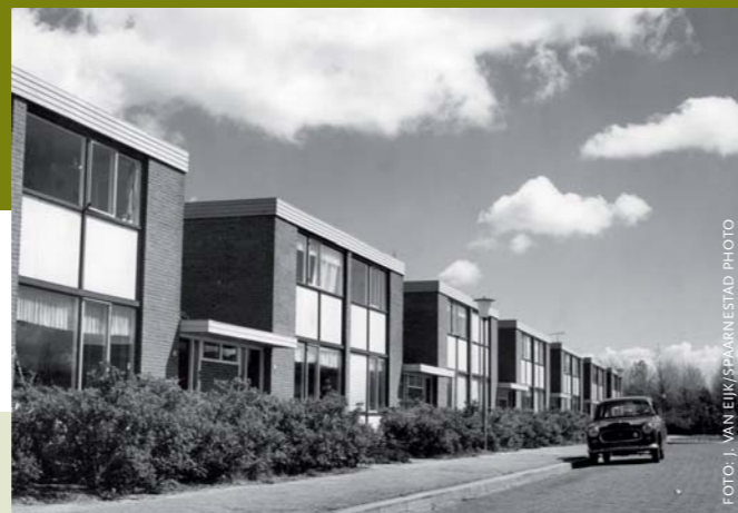
Links: Nagele is het product van twee modernistische architectenverenigingen, De 8 en Opbouw. Dit ontwerp van Van Eyck en Van Ginkel werd uiteindelijk goedgekeurd in 1954.