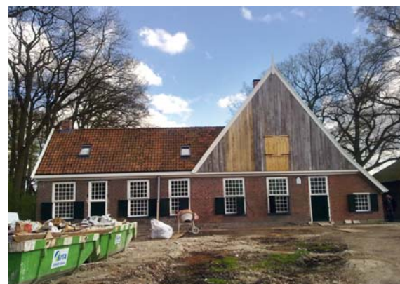
Het Berenbroek, Enschede