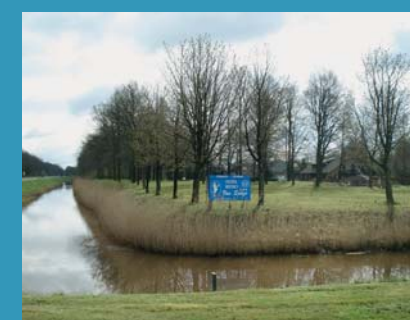
Kraggenburg ligt net als alle andere dorpen aan een poldervaart.