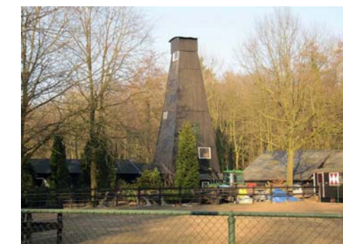
Herinneringen aan het vroegere landschap