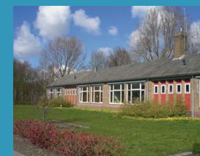
De meeste dorpen, zoals Tollebeek, hebben drie scholen, verspreid in de buurten.