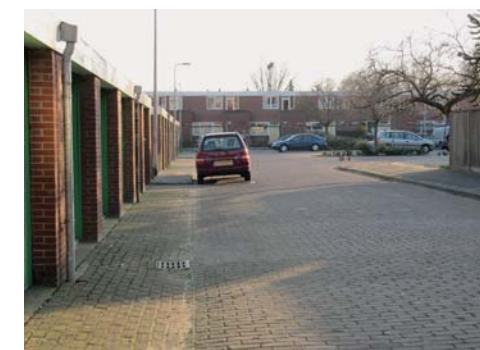
Per stempelenheid een cul-de-sac ingericht als parkeerplein