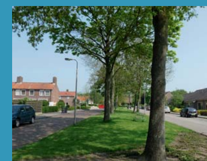
Oorspronkelijk hebben bijna alle dorpen groene straatprofielen en lanen, zoals hier in Luttelgeest.