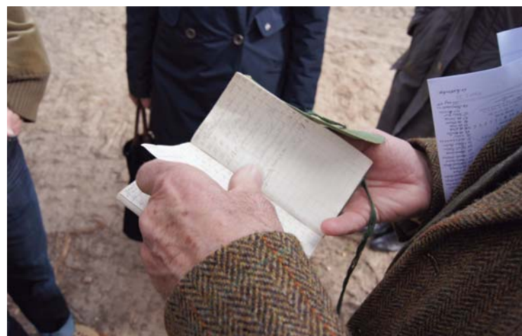
Boekhoudkundige aantekeningen Mataram

Niet alleen de enthousiaste verhalen en de excursie, maar ook de locatie zelf bleek bij te dragen aan een ontspannen en inspirerende dag. De Signatuardag Hardenberg vond bijvoorbeeld plaats in een windmolen van rode en zandkleurige Bentheimer zandsteen pal aan de oever van de Vecht in het Duitse dorp Laar. De grote