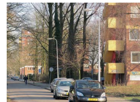
Ritme van afwisselende koppen hoog- en laagbouw