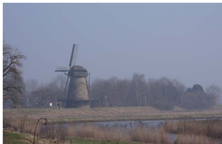
De Vecht bij Laar

In de middag werd in twee afzonderlijke groepen, elk onder leiding van een ontwerper, een schetssessie gehouden. Om te voorkomen dat iedereen zich direct over het papier zou buigen en beginnen met schetsen, is bewust tijd ingeruimd om per groep te bepalen welke specifieke gebiedskenmerken uit de provinciale Omgevingsvisie en verhalen inspiratie en aanknopingspunten (bouwstenen) bieden voor een ruwe ontwerpschets.