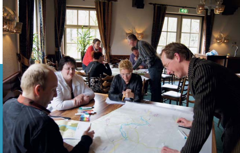
Schetsen in Ommen