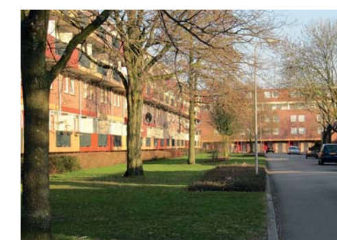
Redelijk onderhouden publiek groen; bomen omzomen de straat