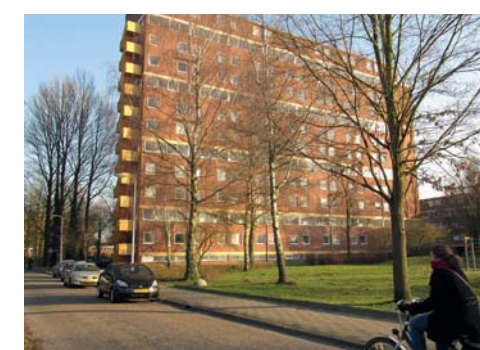
Flat als landmark