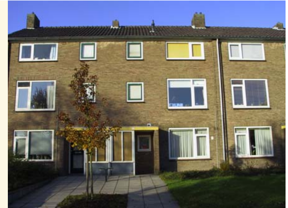
"2 op 1" woningen