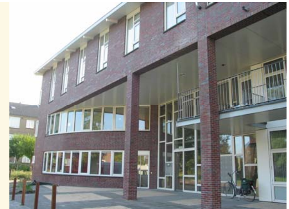
Begeleid wonen (Aveleijn)