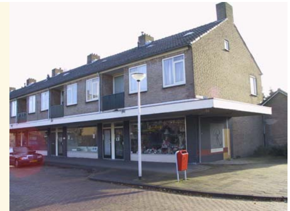
Woningen boven winkels