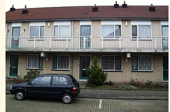
Centraal wonen (senioren)